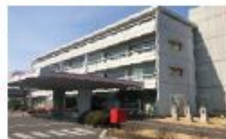
【中央区役所の現状】 築50年が経過し、老朽化が進んでいます。

旧市で残存している唯一の区役所が中央区役所ですが、いよいよ整備計画が来年度中に策定予定です。周辺にある多くの公共施設を再編し、民間の収益施設も誘致することで、コストを抑えつつも近代的な施設へと建て替えを提案しています。