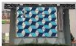
【北与野駅前のからくり時計の現状】

北与野駅前のからくり時計は旧与野市時代にシンボルとして設置されました。オリンピック期間には多くの来場者が訪れることが期待されるので、地元からのご要望も受け、夏前までに塗装の塗り替えと修繕を行います。