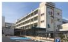
【本町小の新たな施設の外観】

私の母校であり、議員になる前からワークショップに参加して、計画を作りましたが今年4月に完成を迎えます。与野郷土資料館、子育て支援センター、放課後児童クラブが入る施設です。ぜひ多くの方々にご来場いただきたいです。