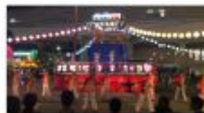
【さいたまの盆踊り】 例えば、北与野駅前で行われている盆踊りも我々の地域の大きな魅力です。

オリンピック開催が目前となりました。中央区においてもさいたまアリーナにてバスケットボールが開催されるので、多くの来訪者にまちの魅力を発信できるよう、また外国人にも日本の文化を楽しんでいただけるよう、中央区のお祭りとの連携も考えたいです。